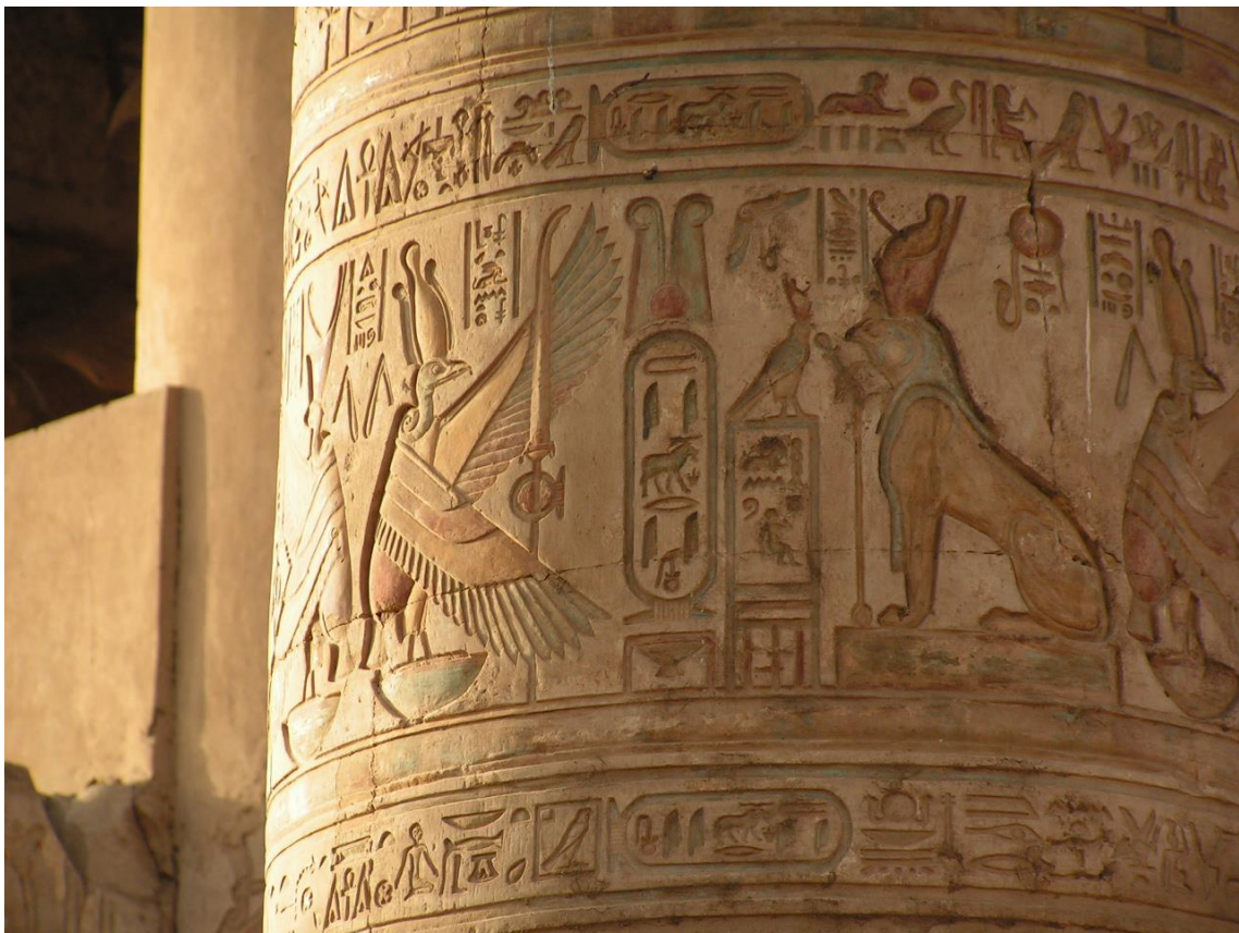
Diosa Nebet , bastón con shen.

El popular cartucho, recibe su nombre porque proviene de los soldados de Napoleón durante su expedición a Egipto. Este símbolo recordaba a los cartuchos de las armas que utilizaron estos soldados durante la guerra.